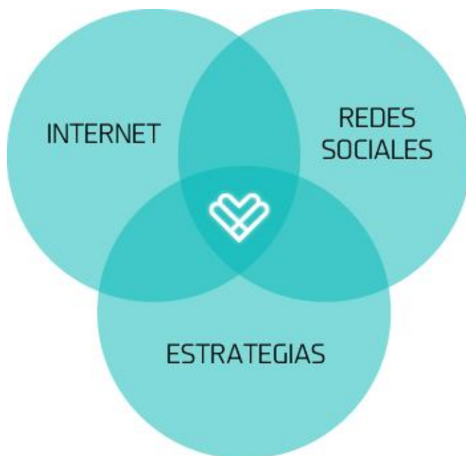
Sistema de Integración Digital

Desarrollar en medios digitales una comunicación bidireccional entre las Empresas y los Usuarios de Internet. Planificar una estrategia para atacar efectivamente y alcanzar los objetivos planteados.